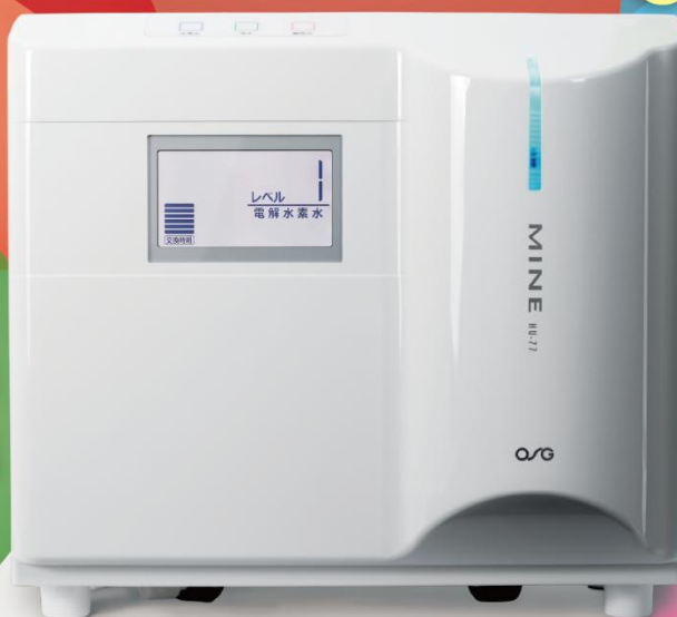
電解水素水生成器